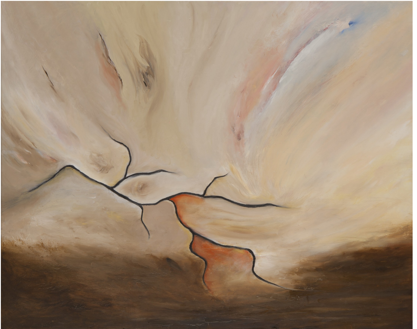
L'Esprit du Noyer