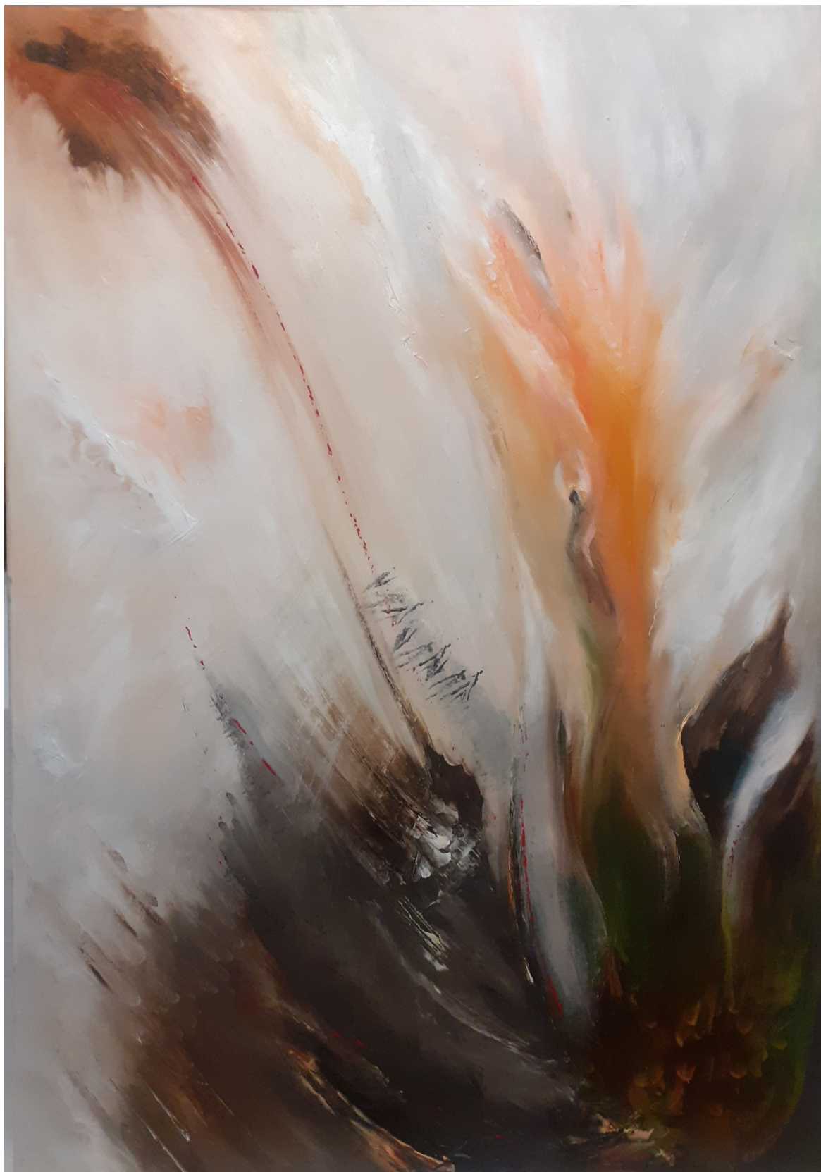
In and Out