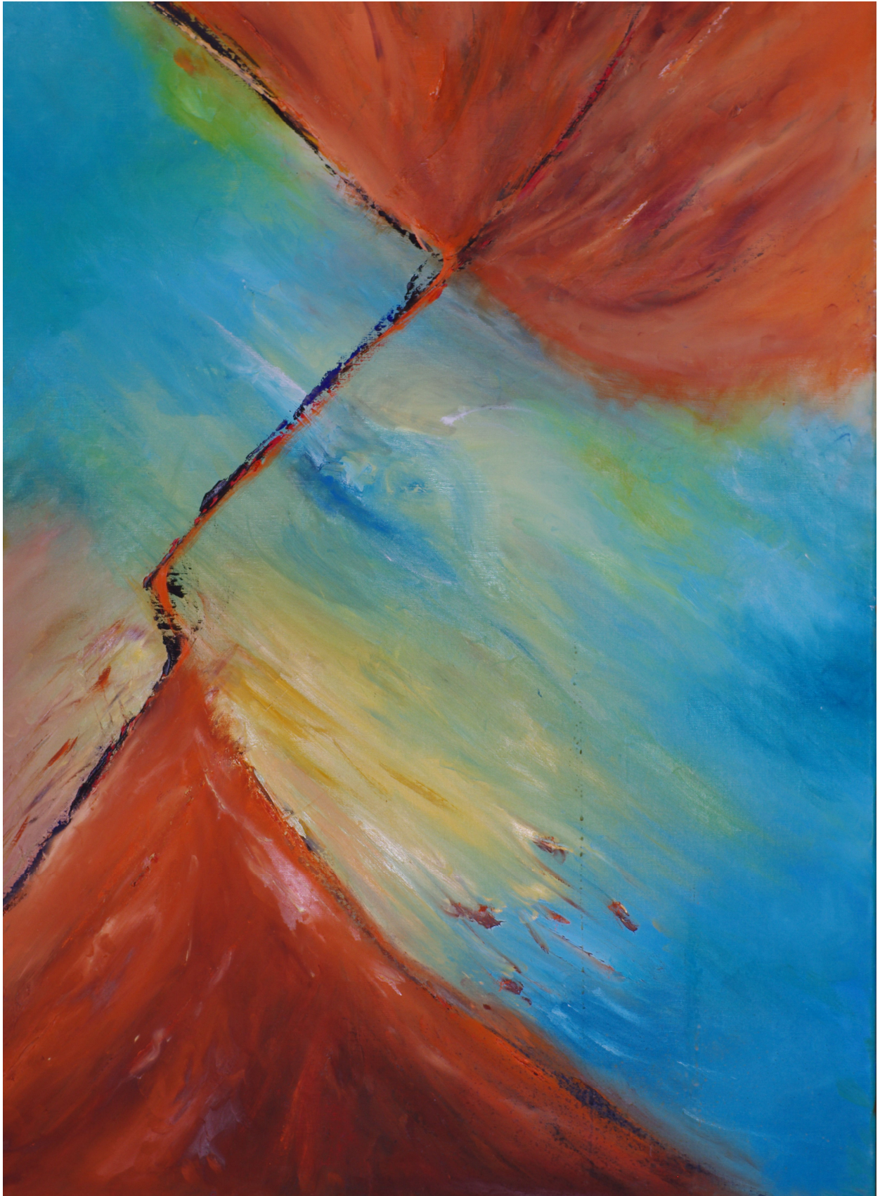
L'Aigle de Buggarach 80/120 cm